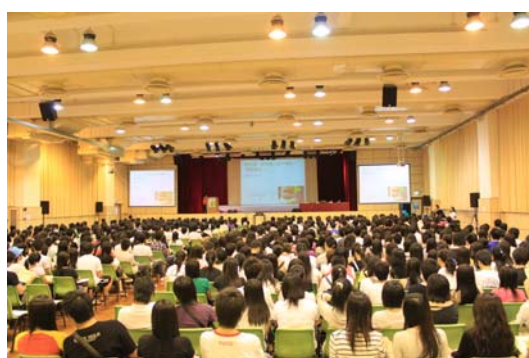
升學與就業講座 (2009 年 9 月 20 日及 21 日)