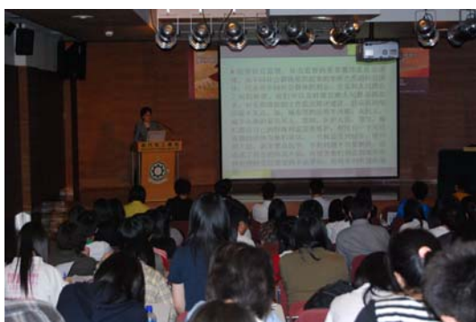
「慶祝建國六十週年國情講座」 (2009 年 4 月 18 日)