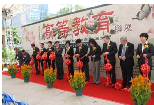
澳門高等教育聯展 (2009 年 11 月 21 日及 22 日)