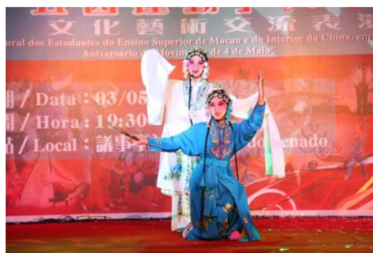
「澳門與內地高校學生紀念『五四運動』九十週年文化藝術交流表演晚會」情況 (2009 年 5 月 3 日)