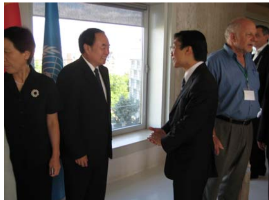
國家教育部周濟部長於聯合國教科文巴黎總部與社會文化司司長辦公室譚俊榮主任交談（2009 年 7 月 4 日）