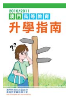
《2010/2011 澳門高等教育升學指南》