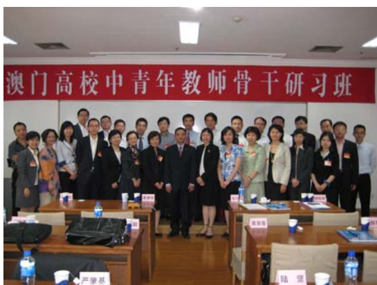
澳門高校中青年教師骨幹研習班（2009 年 10 月 5 至 9 日）