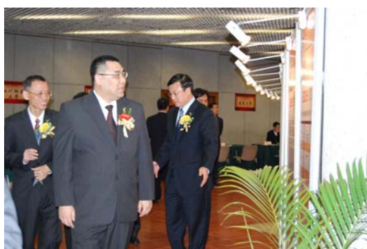
中國內地高等教育聯展 (2009 年 3 月 13 至 15 日)

為向市民提供更多高等教育升學資訊，高教辦於 2009 繼續舉辦了「內地高等教育聯展」和「澳門高等教育聯展」，並派員到各中學為應屆畢業生舉行了 39 場高等教育升學輔導講座，也舉辦了「升學選科工作坊」和「升學與就業講座」。