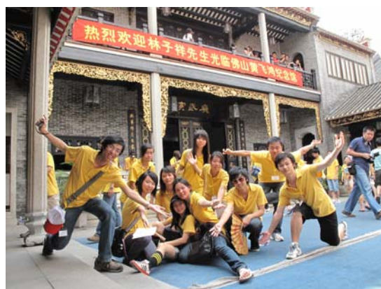
2009 年粵港澳青年文化之旅（2009 年 7 月 12 至 20 日）