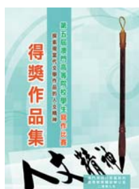
《第五屆澳門高等院校學生寫作比賽得獎作品集》