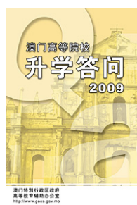
《澳門高等院校升學答問 2009》