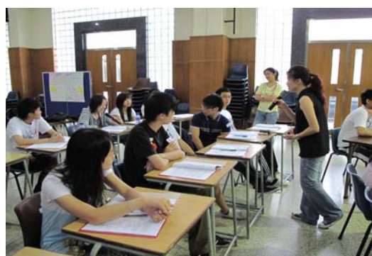
升學選科工作坊 (2009 年 7 月 6 日、13 日、20 日及 27 日)