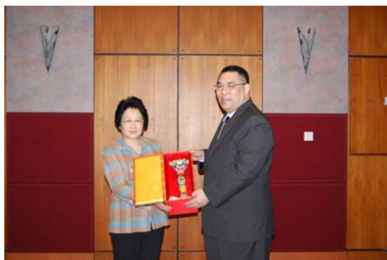
社會文化司崔世安司長與率團訪澳之教育部港澳台事務辦公室丁雨秋常務副主任互贈紀念品 (2009 年 3 月 13 日)