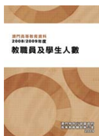
《澳門高等教育資料：2008/2009 年度教職員及學生人數》