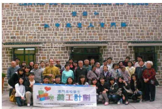
澳門高校學生義工計劃 2008—2009 學員 探訪澳門盲人重建中心 (2009 年 2 月 22 日)

為豐富高等院校學生的課餘生活，發展其潛能及培育其人文素養，高教辦於 2009 年，舉辦了「第五屆澳門高等院校學生寫作比賽」、「慶祝建國六十週年國情講座」、「第七屆澳門高等院校學生辯論比賽（廣州話組、普通話組及英語組）」，並繼續推行「澳門高校學生義工計劃」系列活動，組織高校義工探訪兒童之家、長者護理中心及盲人重建中心等。