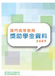
《澳門高等教育獎助學金資料 2009》