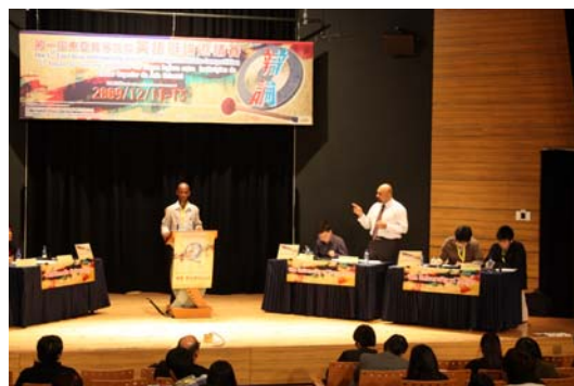
「第一屆東亞高等院校英語辯論邀請賽」 (2009 年 12 月 11 至 13 日)