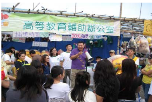
「第四十屆明愛慈善園遊會」攤位情況 (2009 年 11 月 6 至 8 日)