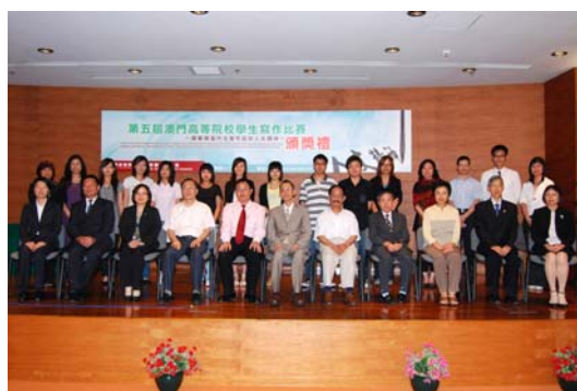
「第五屆澳門高等院校學生寫作比賽」頒獎禮 (2009 年 5 月 22 日)