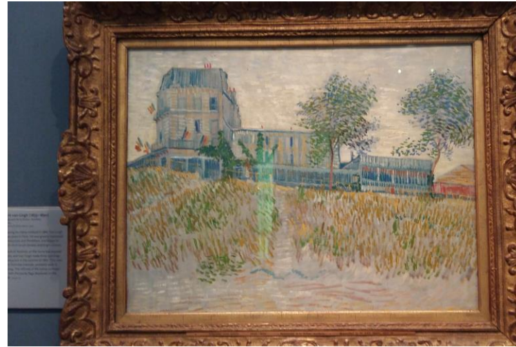
Vincent van Gogh, The Restaurant de la Sirene, Asnières, Ashmolean Museum

英國之旅只佔了我人生很少的一部分，但的確讓我對人生的看法改變了很多，短短的兩星期，讓我大開眼界，切身體驗英國人的生活方式、生活態度、教育方法，種種的得着都令我印象深刻，收獲的遠超我當初的想像，我希望自己可以好好保存這份得着，繼續努力。