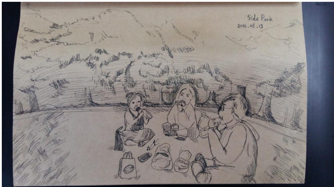
Side Park, Cambridge, 13/08/2016

13 號的晚上，在 City Centre 車站附近的草地吃晚餐。如同一個在地的英國人，在傍晚市集僅剩的紅色餐旅車旁點餐，烤肉、鐵板、炸雞、雜菜沙律，漢堡和卷餅是必不可少的，我們拎着熱騰騰的餐點，在劍橋的草地上坐下，抬起頭發現有很多星星。周圍有一兩撮人坐着、躺着地聊天，我們開着手機的音樂，以盡量不打擾到別人的音量耍樂，縱使我們有那麼一剎擔心劍橋的寧靜被我們打破而收斂些許，而夜晚的寒風又是那麼的滲人，但那的確是我印象最深刻的劍橋夜晚。